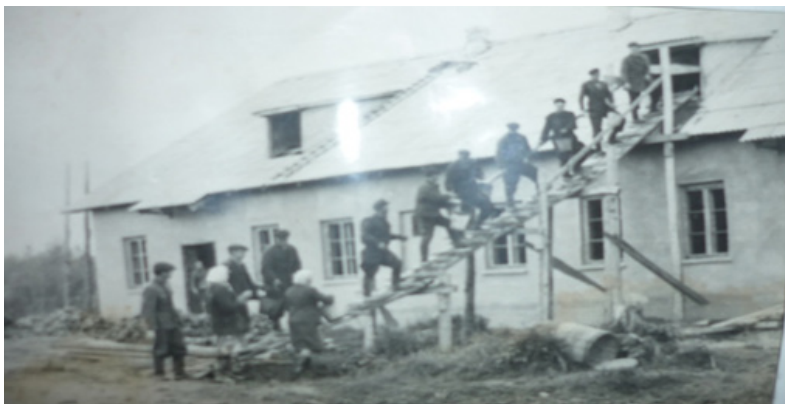
Строительство столовой школы механизации в Краснинском районе