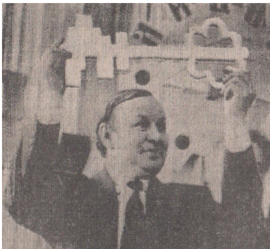
Символический ключ от лица в руках директора — моего папы.

Конечно, должность директора требует постоянной самоотдачи, постоянного эмоционального напряжения. Ведь бывало и трудно, и чувствовалась усталость, и нужно уделить внимание своим родным. Но он всегда помнил, что наступит новый день, и ты должен быть энергичным, бодрым, уверенным в себе, потому что тебя встречают твои обучающиеся, твой коллектив, готовые к новым открытиям и свершениям.