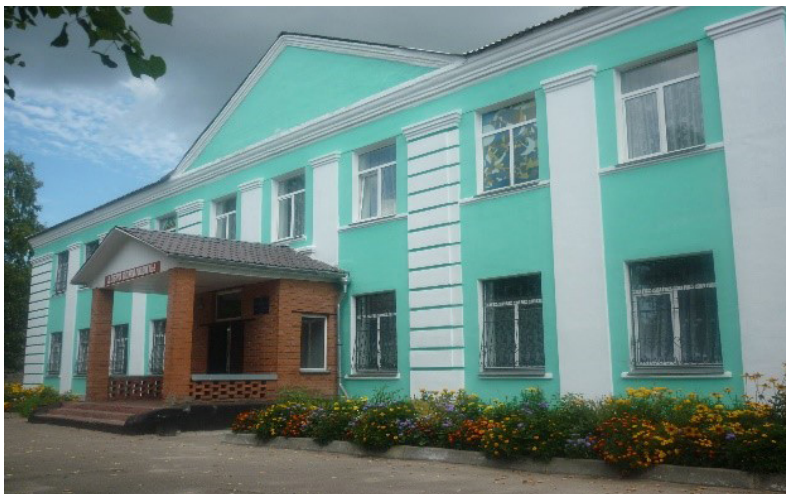
Учебный корпус № 1, современный вид