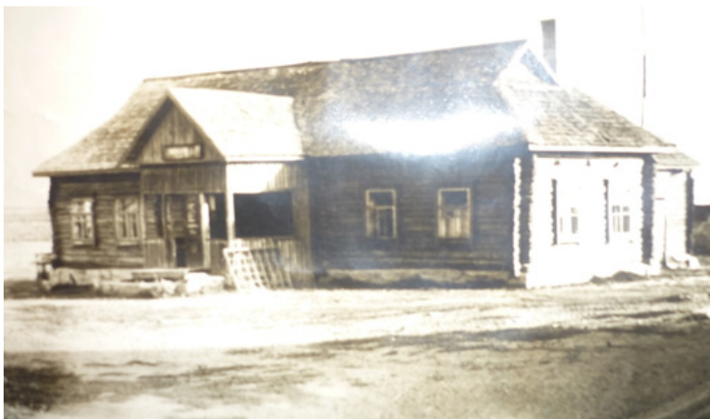
Учебный корпус Краснинской школы механизации сельского хозяйства