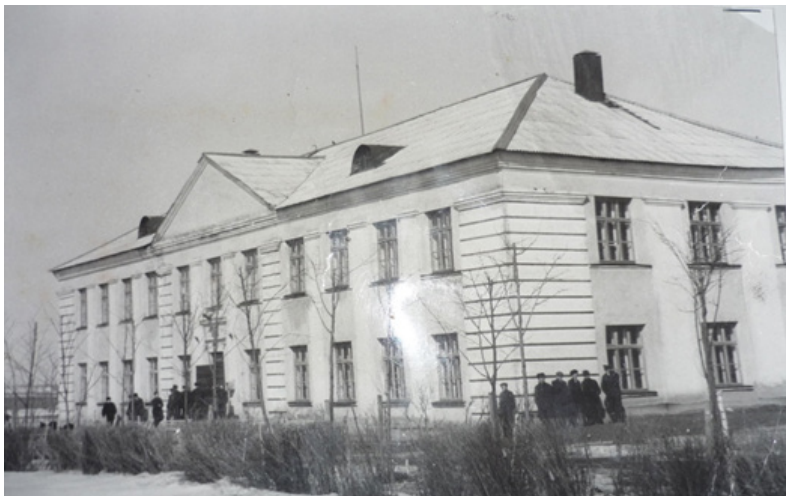
Учебный корпус № 1, 1958 год