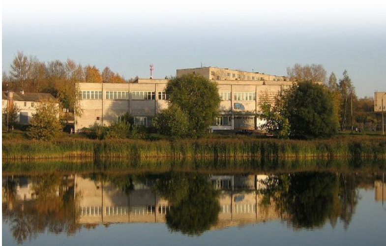
Общий вид здания СОГБПОУ «Ярцевский индустриальный техникум».

Завтрашний день ставит перед Ярцевским индустриальным техникумом следующую ключевую профессиональную задачу: развитие образовательного учреждения как неотъемлемой части региональной инфраструктуры подготовки высококвалифицированных специалистов и рабочих кадров в соответствии с современными стандартами и передовыми технологиями. СОГБПОУ «Ярцевский индустриальный техникум» по-настоящему можно назвать «кузницей рабочих кадров».