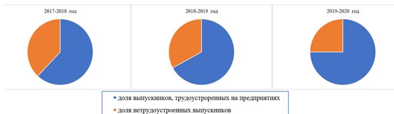
Рис. 1 Динамика трудоустройства обучающихся

Определённую роль в трудоустройстве выпускников играет Центр содействия трудоустройству выпускников и временной занятости населения Колледжа, который обеспечивает 10–30% трудоустроенных от общей доли выпускников, трудоустроенных на предприятиях Смоленской области и других регионов (рис. 1).