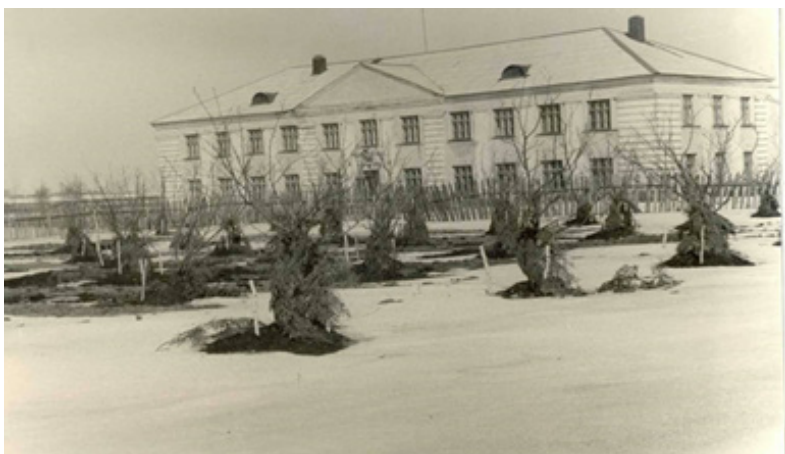
Строительство учебного корпуса в п. Козловка