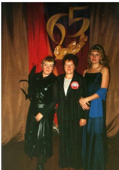
65 лет системе Профтехобразования: я, мама, сестра

Каждый представитель нашей династии по-своему уникальный человек, творческий и талантливый. И для нас лучшая награда — любовь и призвание наших обучающихся. Династия нашей семьи — это люди большого сердца, огромного трудолюбия, высоких моральных качеств. Из поколения в поколение как эстафету передают гордое звание педагогической профессии. Нас объединяет профессионализм, стремление к творчеству, строгая требовательность к себе и желание отдавать сердце детям. Я считаю себя счастливым человеком, потому что у меня есть любимая работа. Сердце моё радуется, когда вижу искрящиеся глаза обучающихся, заинтересованные и счастливые от того, что их любят, уважают, что им доверяют, с ними советуются и дают возможность самостоятельно делать выводы, заниматься поиском правильного решения проблем. Значит, я все сделала правильно и в выборе профессии не ошиблась.